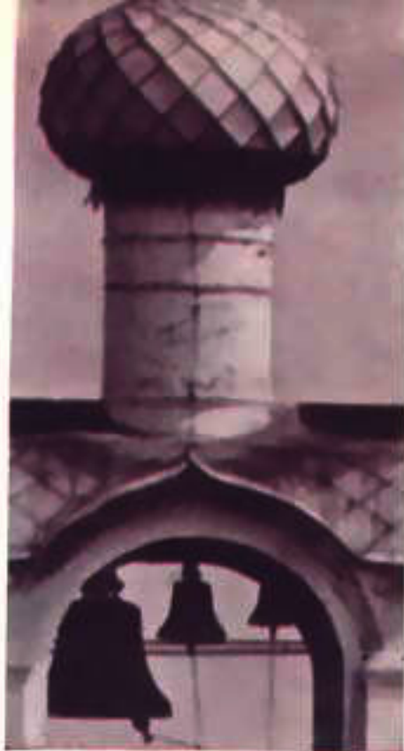
Ростов Ярославский. Кремль.